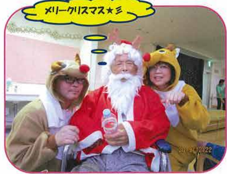
メリークリスマス★