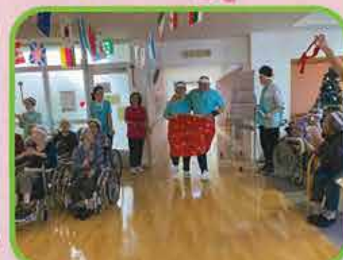
日頃のチームワークを武器に力を合わせて障害物競争!!