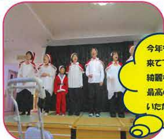
今年も「ゴスペル」の方々が来て下さいました★ 綺麗な歌声・素敵なハーモニー 最高のクリスマスプレゼントをいただきました♪