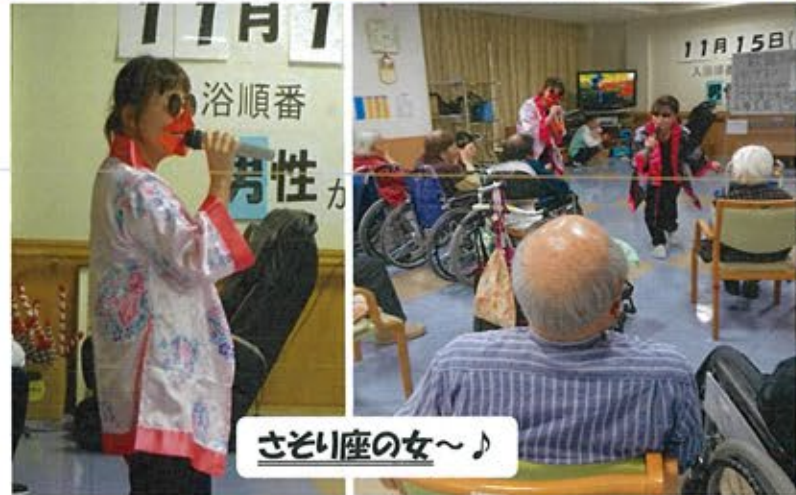
11月 入浴順 女性 さそり座の女~♪