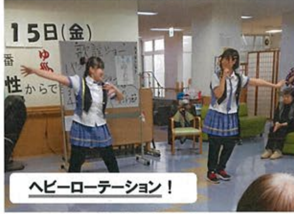
15日(金) ゆめ性からで ヘビーローテーション!