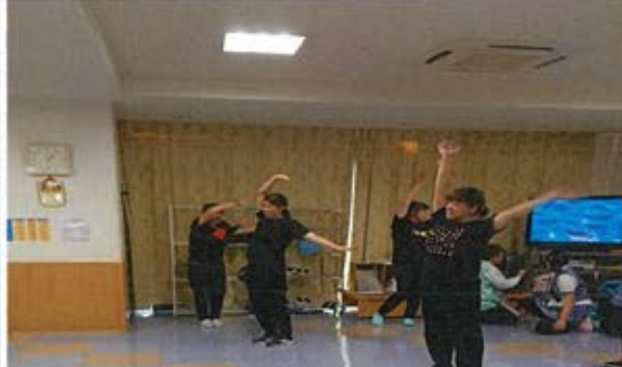
ヤングマン! みんなで踊りましょう!