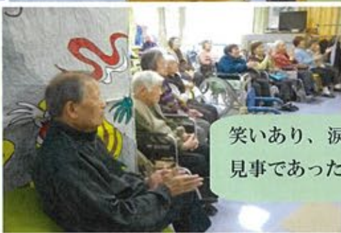
笑いあり、涙ありの劇見事であった!!!!

今回職員による歌謡ショーと劇を行いました。歌謡ショーでは利用者様も一緒に踊ってもらったり「夢芝居」では職員が日本舞踊を披露しました。劇では忠太郎と母の再会シーンや殺陣はすこく盛り上がりました。