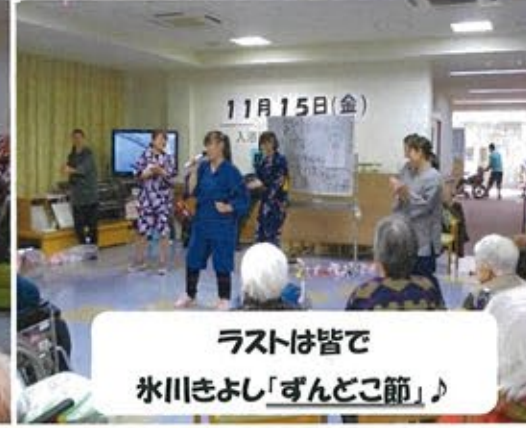
ラストは皆で 氷川きよし「ずんどこ節」♪