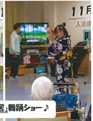
11月 入浴順 男 「夢芝居」舞踊ショー♪